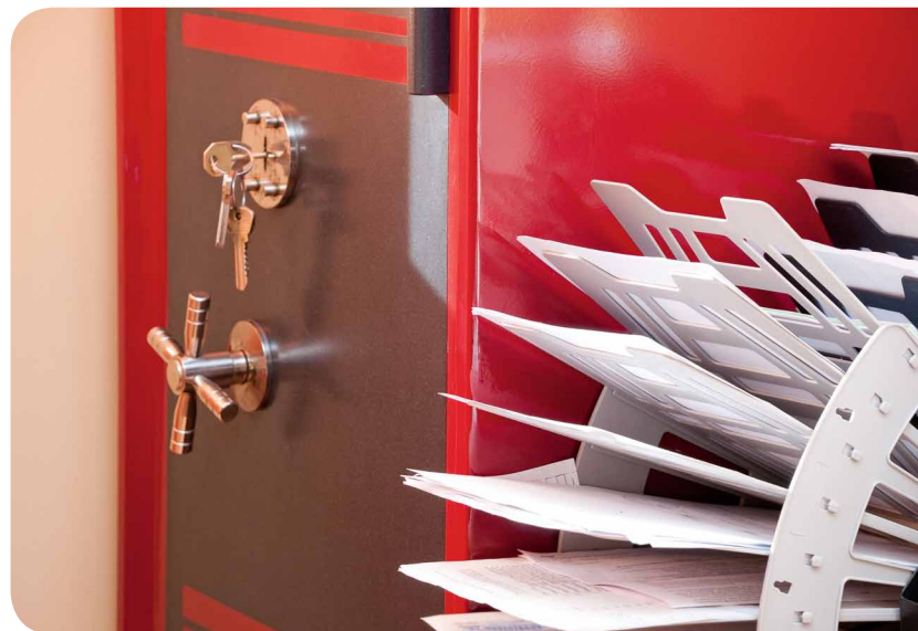
Zdarzają się przypadki umieszczania dokumentacji w zamkniętych szafach z kluczem pozostawionym w zamku.

Duże wątpliwości budzi również etap wdrożenia polityki bezpieczeństwa i instrukcji zarządzania systemem informatycznym. Często okazuje się bowiem, że na-